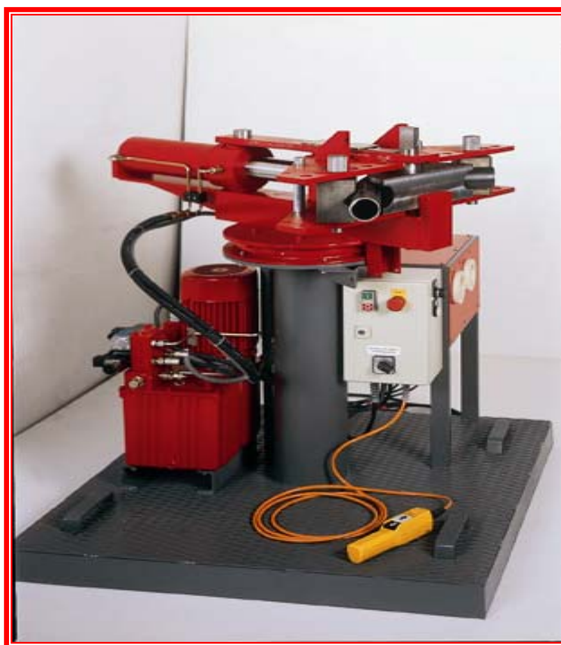
TRANSFLUID MB 2060