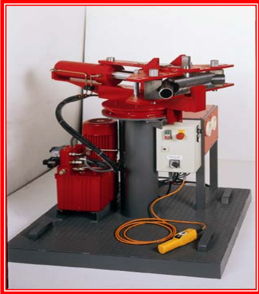
EMB 2060 - Mobilna mašina za savijanje