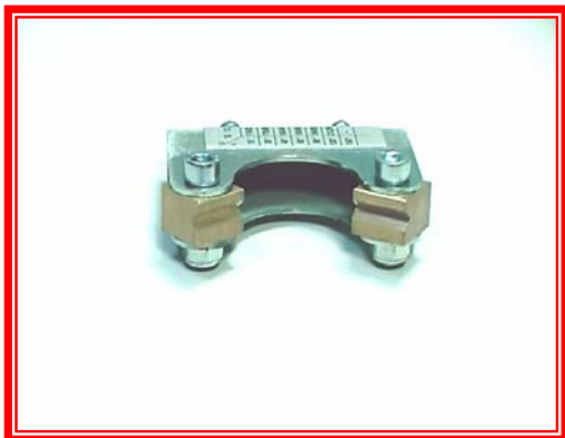
EMGH - Leteća glava sa mesinganim uloškom