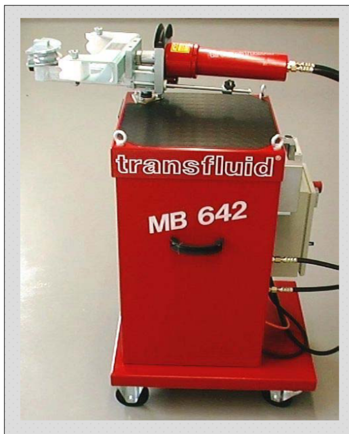
TRANSFLUID MB 642