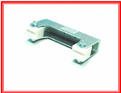
EMGH - Leteća glava sa plastičnim uloškom