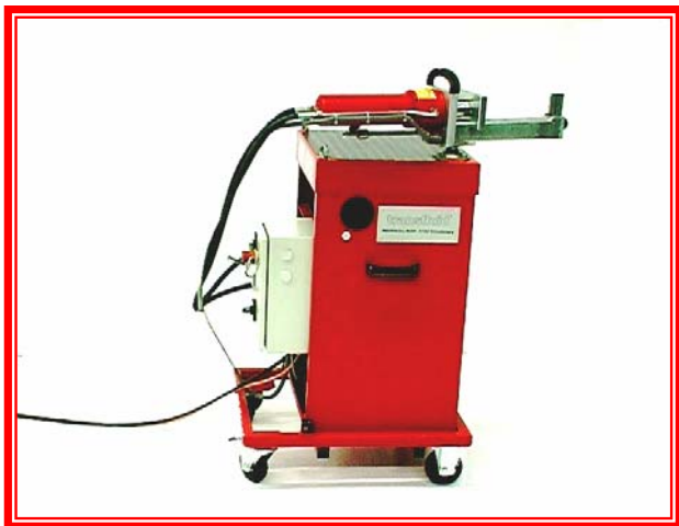
EMB 642 - Mobilna mašina za savijanje